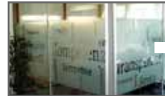
3M Sichtschutzfilme Seite 17