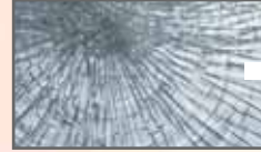
3M Splitterschutzfilme Seite 16