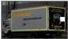
3M Scotchlite Konturmarkierung Seite 14