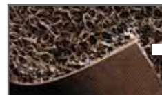
3M Nomad Gepäckraumbelag Seite 18