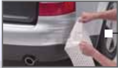
Scotchgard Lackschutzfolien Seite 7-9