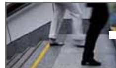
3M Safety Walk Anti-Rutschbelag Seite 19