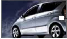
3M Automotive Sonnenschutzfilme Seite 4-6