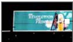
3M Scotchlite Retroreflektierende Folien Seite 15