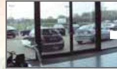
3M Schaufensterfilme Seite 16