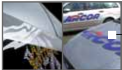
Trim-Line Car Design / Creativ Promotion / DI-NOC / Car Wrapping Seite 10-13